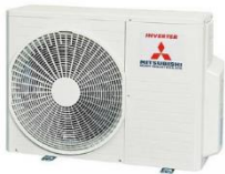
SCM 40 ZM-S

* Die Preise der SX-Innengeräte gelten nur bei gleichzeitiger Bestellung eines entsprechenden SX-Außengerätes aus dieser Aktion Preisliste