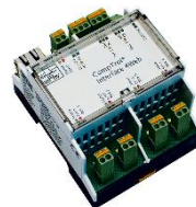
CompTrol Interface 4Web